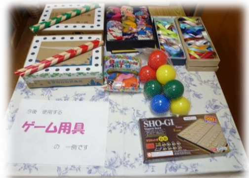
20回の教室活動に使う用具の一例