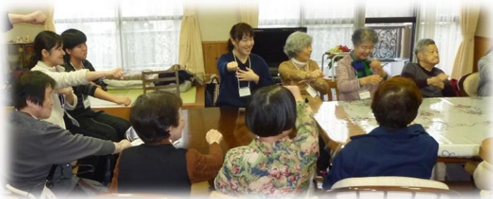
指を使ったゲー・パー体操

「楽しいゲーム」と「やさしさのシャワー」がこの教室の特徴です。認知症予防を考えている方や、心身の不調で元気を失っている方など、どなたでもご参加ください。